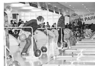
第26回ボウリング大会