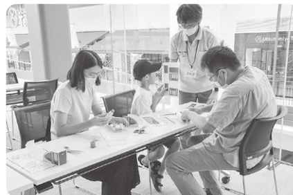
▲ ペーパークラフトでLRTを作る家族