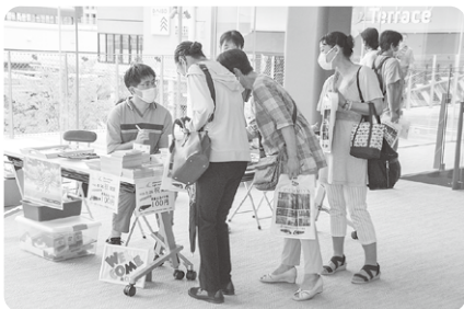
▲ ホワイエでの施設等製品販売の様子