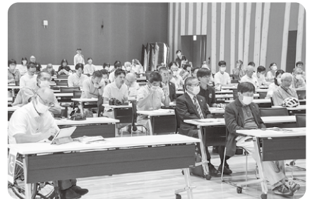
▲ 熱心に講演を聞く来場者